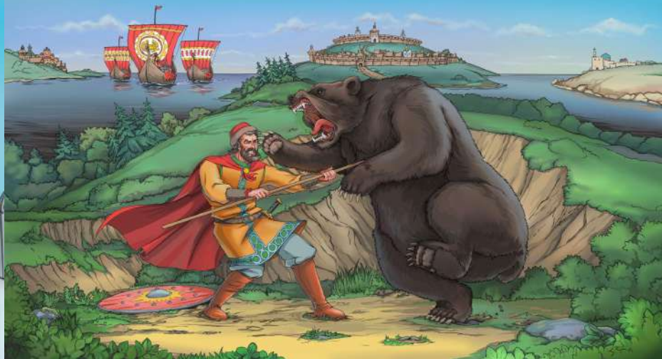
Авторские иллюстрации из проекта "Кристалл истории"